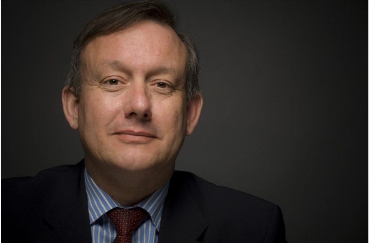
Afbeelding: Gerard Dubois

De regio Zwolle moet zich, met steun van de hierin gespecialiseerde ontwikkelingsmaatschappij Oost NL, meer inspannen om meer internationale bedrijven naar Overijssel te halen. Twente wist, volgens SER Overijssel, vorig jaar 15 buitenlandse bedrijven binnen te halen, vooral in Enschede, tegenover een in Zwolle en omgeving. Dat verschil wordt voor een belangrijk deel verklaard door de aanwezigheid van Universiteit Twente. Voor veel bedrijven is de relatie en de directe nabijheid daarmee belangrijk.