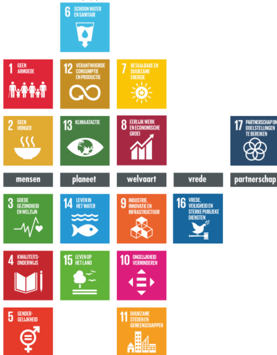
Figuur 1: De SDG's verdeeld naar vijf pijlers